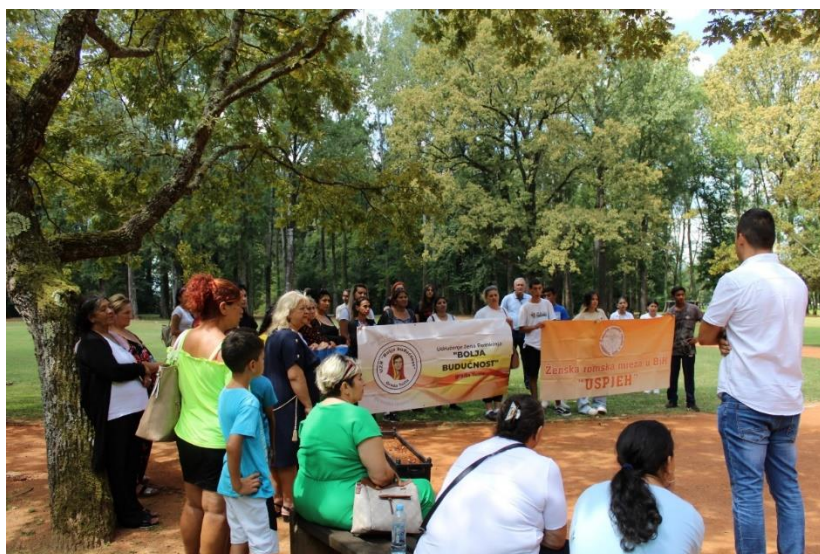
Foto: Komemoracija spomen područje Donja Gradina

U Sarajevu je 11. septembra 2024. godine u zgradi UN House održano predstavljanje Strategije ženske romske mreže „Uspjeh“ za period 2024-2027, pripremljene uz podršku Embassy of Sweden in Sarajevo i UN Women Bosnia and Herzegovina. Ženska Romska Mreža "Uspjeh" BiH kao neformalna mreža udruženja žena i aktivistica, postigla je značajne rezultate u podršci Romkinjama u Bosni i Hercegovini. Mreža se istakla kao važan akter u romskoj zajednici, predano zagovarajući unapređenje zaštite ljudskih prava Romkinja, sa posebnim fokusom na borbu protiv porodičnog i svakodnevnog nasilja, ekonomske eksploatacije, prosjačenja, trgovine ljudima i drugih oblika marginalizacije.