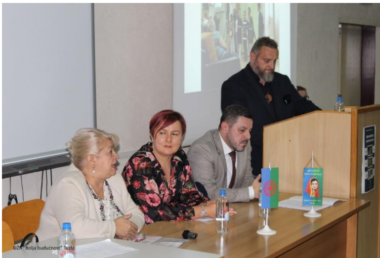
Foto: Obilježavanje Svjetskog dana romskog jezika

U saradnji s Filozofskim fakultetom Univerziteta u Tuzli, obilježili smo 6. novembra 2024. godine Svjetski dan romskog jezika. Ovaj događaj naglasio je važnost očuvanja romskog jezika i kulture, te je istaknuo postignuća poput uvođenja romskog jezika u obrazovni proces Tuzlanskog kantona. Prisutni su imali priliku čuti inspirativne primjere Saveza Roma „Kali Sara“ iz Hrvatske i uživati u kulturnom programu učenika Gimnazije „Ismet Mujezinović“ iz Tuzle. Događaj su podržali predstavnici Ministarstva za ljudska prava i izbjeglice BiH, kantonalnih ministarstava, međunarodnih organizacija i članovi romske zajednice. Cilj manifestacije bio je podsjetiti na značaj očuvanja romskog jezika kao ključnog dijela identiteta romske zajednice.