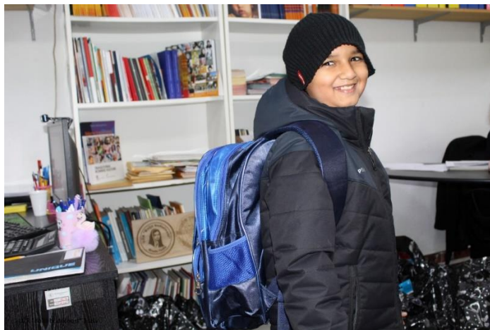
Foto: Podjela školskog pribora

Naše udruženje je zahvaljujući velikodušnoj podršci i donaciji Pomozi.ba uspješno organizovalo podjelu školskog pribora za romske učenice i učenike. Podjela školskog pribora za romske učenike u osnovnim i srednjim školama ima veliki značaj, jer omogućava djeci iz romskih porodica da lakše pristupe obrazovanju i prevaziđu prepreke koje mogu nastati zbog finansijskih teškoća.