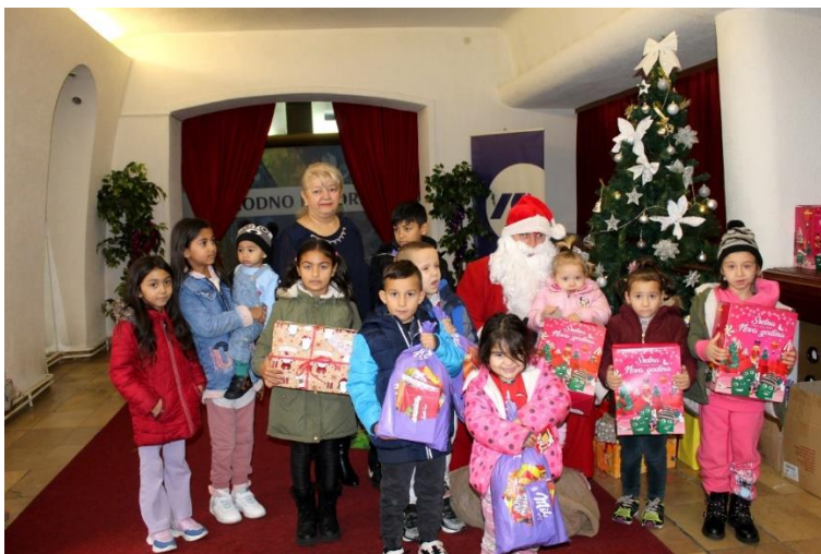
Foto: Podjela novogodišnjih paketića

Podjela novogodišnjih paketića za djecu ima veliki značaj jer predstavlja simbolički čin brige i pažnje prema najmlađima, posebno onima koji potiču iz socijalno osjetljivih i marginalizovanih zajednica. Ovaj gest ne samo da donosi radost i veselje djeci, već im pruža osjećaj jednakosti i uključivanja u društvo, posebno tokom prazničnog perioda kada su svi obdareni pažnjom. Takođe, podjela paketića je i prilika za jačanje zajedništva i solidarnosti, te za izgradnju pozitivnih odnosa unutar zajednice, uz podršku donatora i organizacija koje se zalažu za bolje uslove života djece.