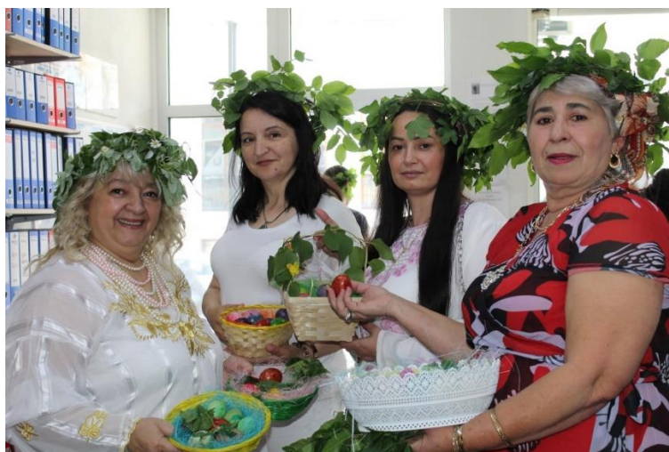
Foto: proslava Đurđevdana