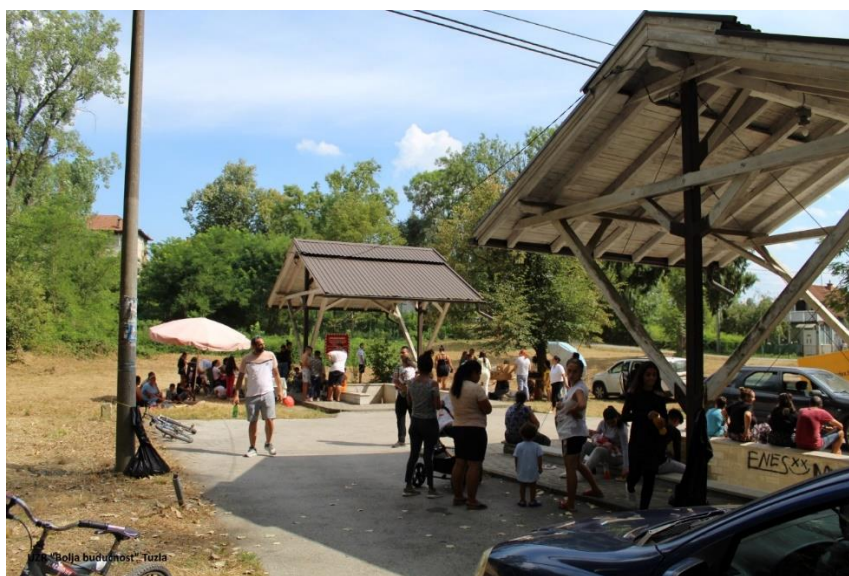
Foto: proslava Aliđuna